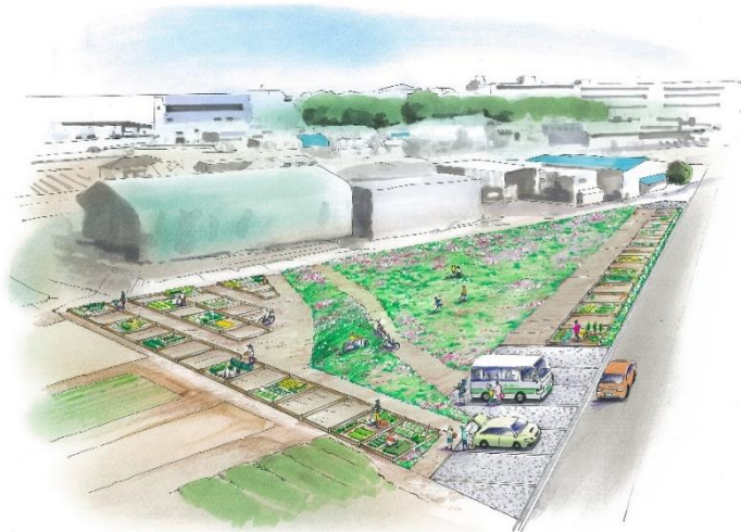
計画地イメージスケッチ