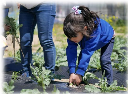
農業・園芸イベントイメージ （収穫体験の様子）