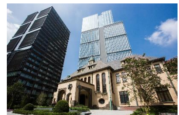
東京ガーデンテラス紀尾井町