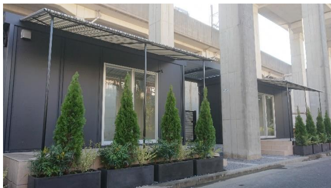
エミキューブ桜台

“自分だけの時間を愉しむ空間”としてテレワークや趣味を愉しむ「はなれ」の利用に加え、趣味や特技を活かしたミニショップやサロン、オフィスとしてもご利用いただけます。さらに、お客さまの多様なニーズに対応すべく、全4室のうち3室を月極、1室を時間貸しにて提供いたします。