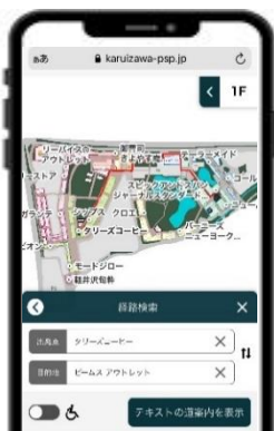
アプリ利用イメージ