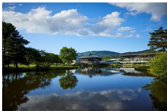
軽井沢・プリンスショッピングプラザ