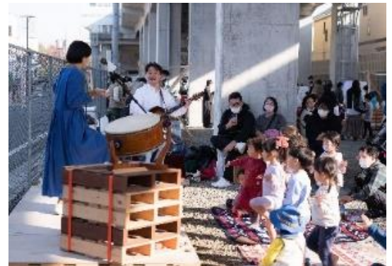
前回開催時の様子（テーマ：食×教育）

さまざまなスポーツ体験コンテンツにより、スポーツを通じたコミュニケーションが自然と生まれ、地域交流を深める機会を創出します。また、アウトドア体験コンテンツでは、高架下を『初心者にはハードルが高いキャンプを都内で気軽に挑戦できる場』としてご提供し、キャンプ時はもちろん災害時にも役立つノウハウをお伝えすることで、地域の皆さまに防災について身近に体感していただけます。