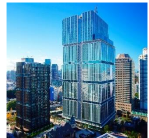
東京ガーデンテラス紀尾井町