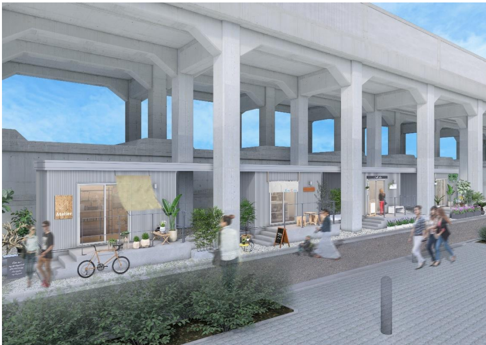
エミキューブ桜台Ⅱ 完成イメージ