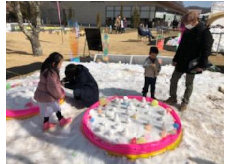
▲「スノーパーク」昨年開催の様子 （※画像はイメージです）