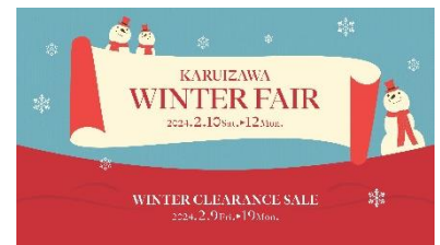
▲「KARUIZAWA WINTER FAIR」メイン画像

株式会社西武リアルティソリューションズ（本社：東京都豊島区、代表取締役社長：齊藤朝秀）が保有・運営するリゾート型ショッピングモール「軽井沢・プリンスショッピングプラザ」では、軽井沢の冬を存分に楽しめるイベント「KARUIZAWA WINTER FAIR」を開催いたします。開催期間中、2月10日（土）・2月11日（日・祝）には「KARUIZAWA SNOW FESTA」を、また2月12日（月・振休）には「ケーキデコレーション体験」をそれぞれ開催いたします。