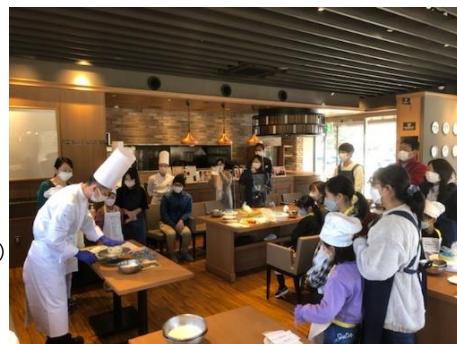
▲「ケーキデコレーション体験」昨年開催の様子（※画像はイメージです）