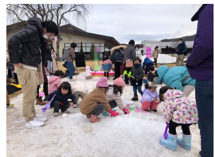
▲「雪中宝探し」昨年開催の様子 （※画像はイメージです）