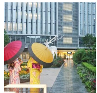
カラフルな和傘で記念撮影 (写真はイメージです)