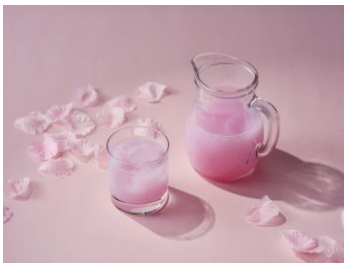
野田焼売店 カクテル「パステル・ピンク」 960 円 (税込) /

人気のボロネーゼに春野菜をあしらったイタリアンなお弁当です。おしゃれなお花見のお供にどうぞ。お子さまにもおすすめです。