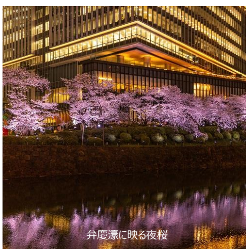
弁慶濠に映る夜桜