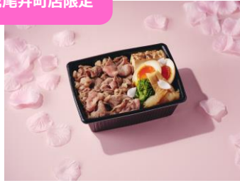
米幸 「春野菜の牛すき焼き重弁当」 1,000 円 (税込)

春の味覚を堪能する黒毛和牛の牛すき焼き重。菜の花とたけのこの爽やかな香り広がる、贅沢な春のお弁当です。お花見のお供にぜひどうぞ。