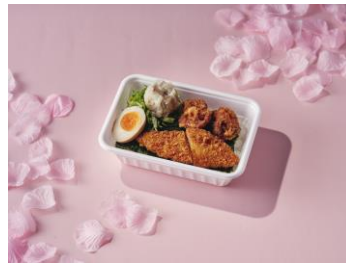
野田焼売店 「お花見弁当」 800 円 (税込)

香り高い海苔ごはんの上に、焼売、唐揚げ、白身魚のフライ、味付け玉子と人気商品を全部載せて大満足の一品。花見散歩の腹ごしらえにぜひどうぞ。