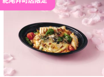
ガーベセントラル 「淡路産牛ボロネーゼと春野菜のラザニア」 1,300 円 (税込)

人気のボロネーゼに春野菜をあしらったイタリアンなお弁当です。おしゃれなお花見のお供にどうぞ。お子さまにもおすすめです。