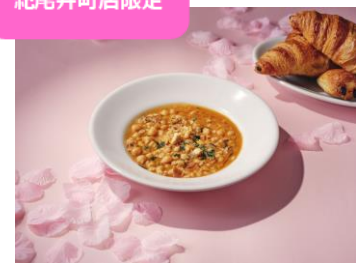
アンティキサポリー / スーペルパッコ 「春の日替りイタリアスープ」 880 円 (税込)

春らしいイタリアスープをテイクアウトでご用意いたしました。別売りのパンとあわせて軽いランチとしてどうぞ。お味は日替わり、何になるかはその日のおたのしみ。