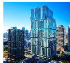
東京ガーデンテラス紀尾井町

所在地：東京都千代田区紀尾井町 1-2 他 ※建物、施設により住所が異なりますのでご確認ください。 最寄駅：東京メトロ 半蔵門線・有楽町線・南北線『永田町駅』9a 出口直結 東京メトロ 銀座線・丸の内線『赤坂見附駅』D 出口から徒歩 1 分 公式 HP： https://www.tgt-kioicho.jp/