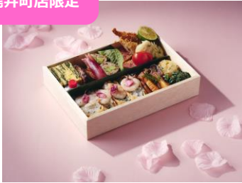
銀座 崙いち 「花見弁当」 3,500 円 (税込)

春の食材をあしらった華やかな花見弁当です。旬の味を生かした和の心をお楽しみください。桜の香りと彩りのいなり寿司も入って満足感のある一品です。