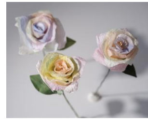
美濃和紙を用いたパステルローズ

https://kioispring-0413-washi.peatix.com