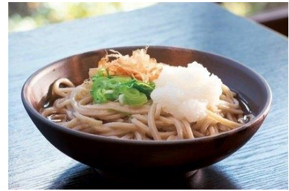
▲「越前おろしそば」(※画像はイメージです)