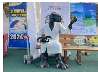
▲恐竜王国福井ご提供「恐竜ベンチ」 (昨年開催時の様子)