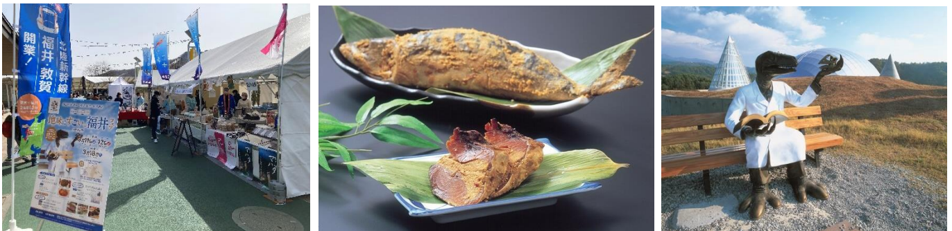
▲左「地味にすごい、福井フェア in 軽井沢」（昨年開催時の様子）、中央「サバのへしこ」、 右「恐竜ベンチ（恐竜王国福井提供）」（※画像はイメージです）

3月16日（土）・3月17日（日）には、北陸新幹線の福井県敦賀市延伸に伴う、福井県との連携イベント“福井がいま、おもしろい！ in 軽井沢”「福井県観光・物産フェア」を、また3月30日（土）・3月31日（日）には昨年「軽井沢アートリンク at ハロウィン」イベントでご好評をいただいた障がい者アートをラッピングした「ストリートピアノ」をそれぞれ開催いたします。