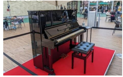
▲「ストリートピアノ」（※画像はイメージです）

イベントの詳細は「KARUIZAWA SPRING EVENT」イベント特設サイトをご覧ください。