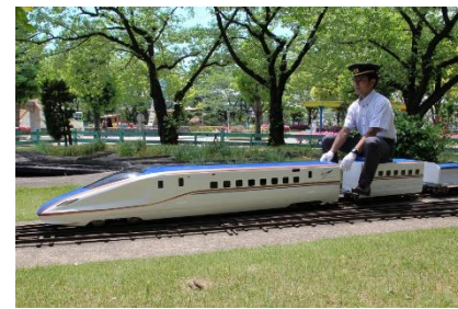
JR東日本商品化許諾済