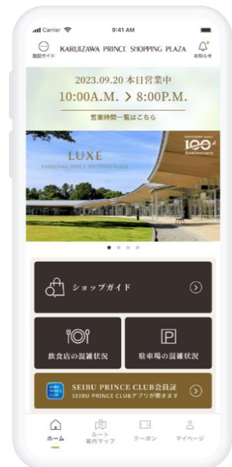
アプリリニューアルイメージ