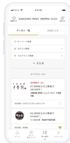
アプリクーポン画面イメージ