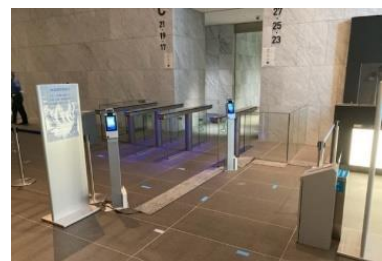
オフィス棟入館時の体温測定