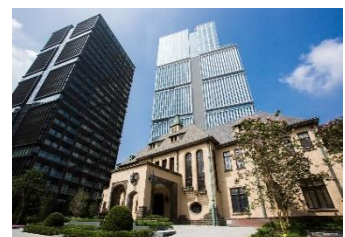
東京ガーデンテラス紀尾井町