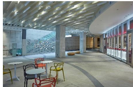
紀尾井テラス 内観